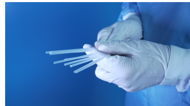
Tubes plongeurs extrudés

“ MIP PLASTIC oeuvre aux côtés de ses clients pour les accompagner dans l'éco-conception, le choix de matériaux durables et respectueux, le choix de fournisseurs engagés, la production éco-responsable... ”